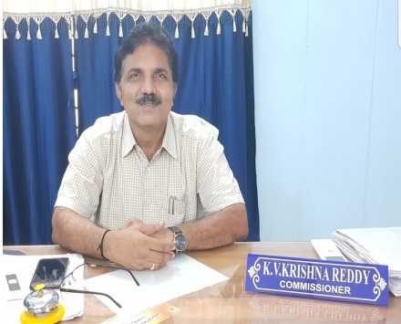
చెల్లింపుదారులు, ఈ యొక్క సదవకాశాన్ని సద్వినియోగం చేసుకొని వడ్డీ మినహాయింపు లబ్ధిని పొంది మీ యొక్క ఆస్తి మరియు ఖాళీ జాగా పన్ను బకాయిలను వడ్డీ లేకుండా మార్చి 31 లోపు చెల్లించవలసినది గా కమిషనర్ కోరారు

ఆంధ్రప్రదేశ్ రాష్ట్ర ప్రభుత్వం జి. ఓ. ఎం. యస్. నెం. 34 ఎం. ఏ. ఉత్తర్వుల మేరకు రాష్ట్రం లో అన్ని నగరపాలక మరియు పురపాలక సంఘాలలో ఆస్తి మరియు ఖాళీ జాగా పన్నుల విషయంలో ఈ ఆర్థిక సంవత్సరం వరకు ఉన్న బకాయిలు మరియు ఈ ఆర్థిక సంవత్సరం పన్ను పై విధించిన వడ్డీని వన్ టైమ్ మెజర్ గా మాఫీ చేయడం జరిగినది. అయితే, పన్ను చెల్లించవలసిన పన్ను చెల్లింపుదారులు బకాయి ఉన్న మొత్తాన్ని ఈ ఆర్థిక సంవత్సరం తో సహా ఒకే సారి తేది. ఈ నెల చివర్లోపు చెల్లించినట్లైతేనే ఈ వడ్డీ మినహాయింపు వర్తిస్తుంది. కావున, ఆస్తి పన్ను